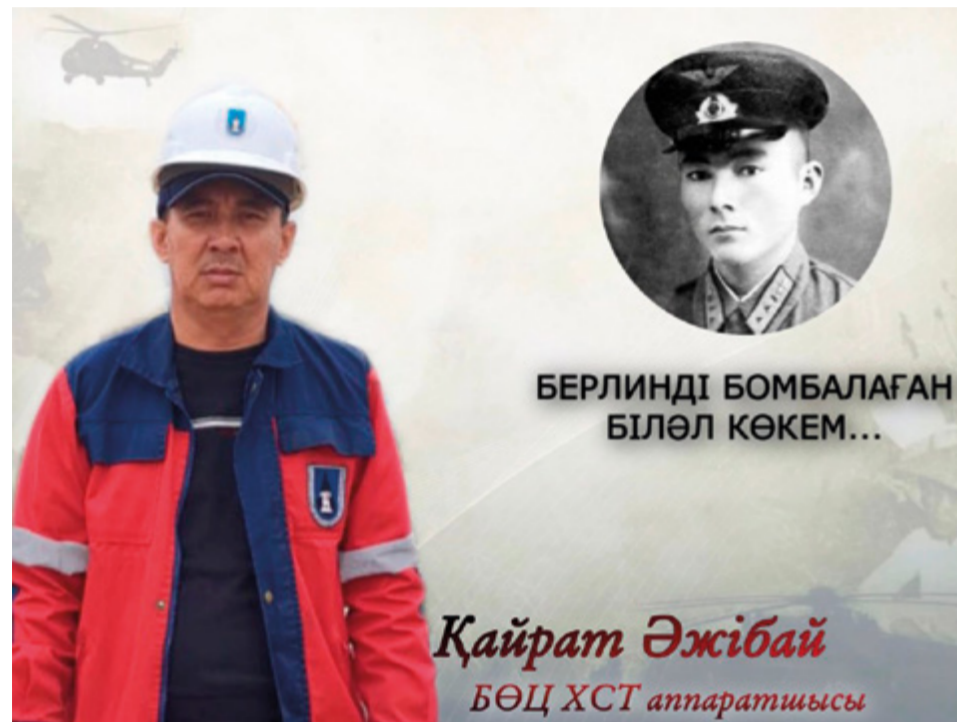
БЕРЛИНДІ БОМБАЛАҒАН БІЛӘЛ КӨКЕМ...